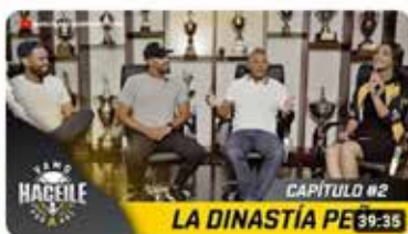
Vamo Haceile Podcast | Temporada 1 | Episodio 2 25 K visualizaciones • hace 7 días