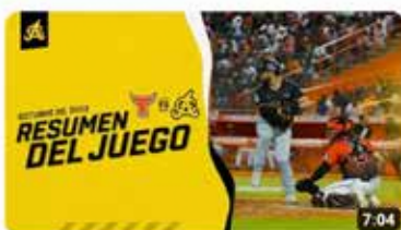
Highlights: Águilas Cibañas vs Toros del Este | 20 de Octubre 2023 2,8 K visualizaciones • hace 2 semanas