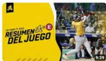
Highlights: Águilas Cibañas vs Leones del Escogido | 27 de Octubre 2023 3,2 K visualizaciones • hace 9 días