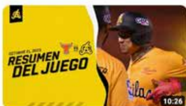
Highlights: Toros del Este vs Águilas Cibañas | 21 de Octubre 2023 10 K visualizaciones • hace 2 semanas