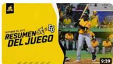
Highlights: Águilas Cibañas vs Estrellas Orientales | 25 de Octubre 2023 23 K visualizaciones • hace 12 días