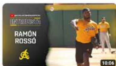
Águilas Camp 2023 | Ramón Rossó 3,4 K visualizaciones • hace 2 semanas